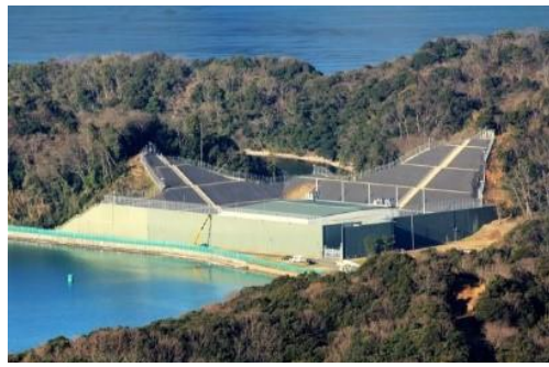
改修予定の白浜にあるミサイル整備所

射程1000キロ〜3000キロの先制攻撃用ミサイル「トマホーク」(1つが5億円)が舞鶴の2隻のイージス艦に装備されようとしています。舞鶴に弾薬庫新設 武器よりくらし・被災者支援」