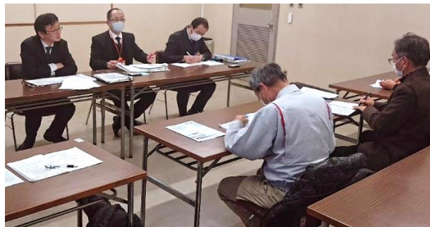
福知山市と交渉する福知山平和委員会の人たち

「申し入れ」の回答が26日に市役所市長公室で行われ、政府からの説明内容と、市としての対応などが説明されました。国からの説明の「受け売り」と、市民の心配をよそに粛々と進めようとする市の姿勢に不信と疑問の声が上がりました。各団体から6人の代表