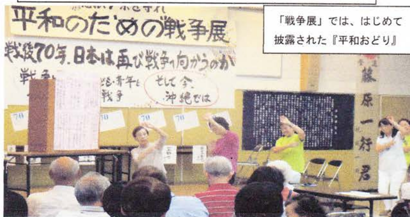
「戦争展」では、はじめて披露された『平和おどり』